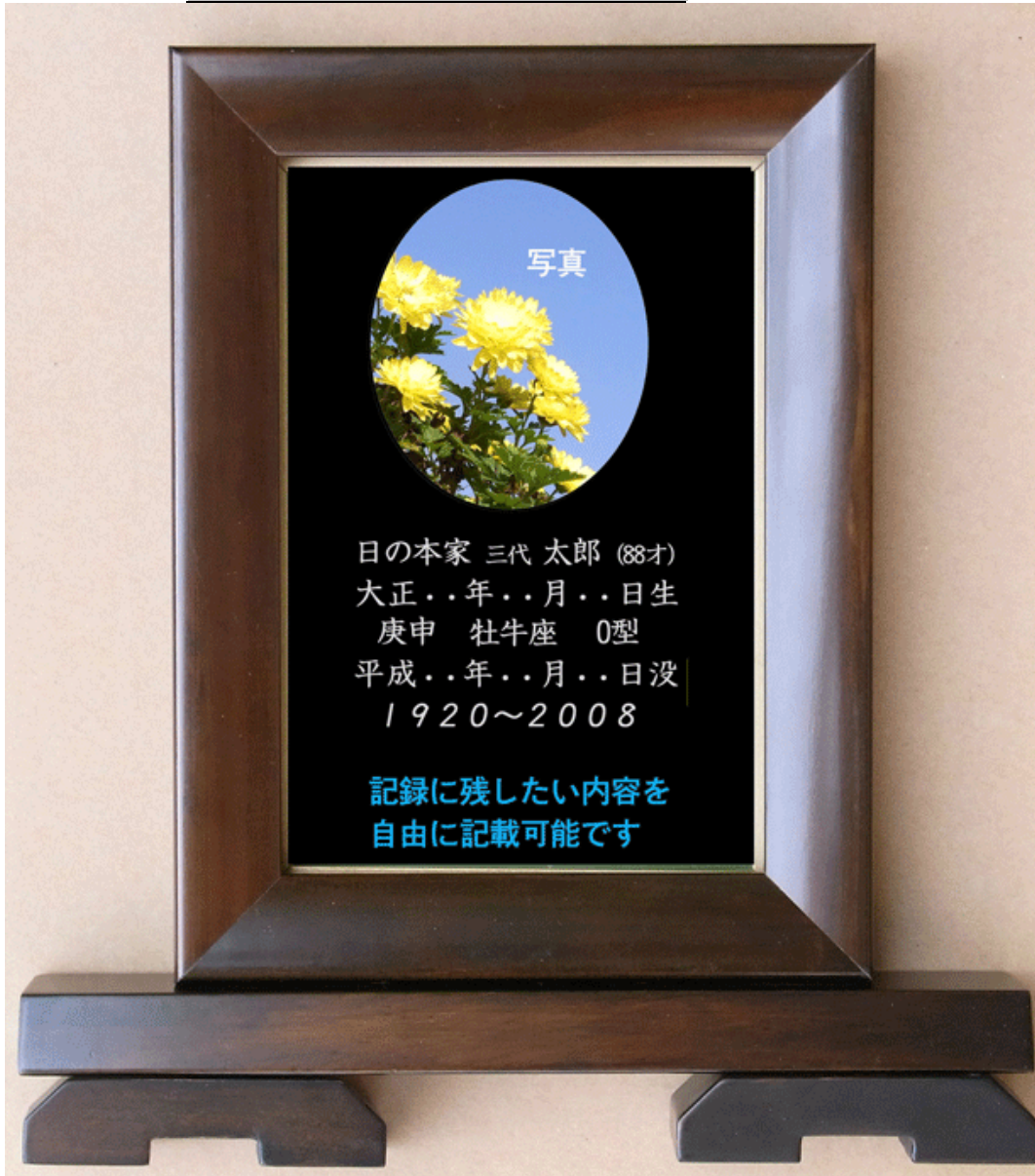
故人録【絆】写真・記録タイプ 製作元直販 ¥19,800 円